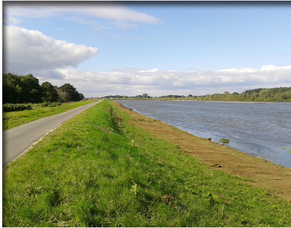
Digue de Sully-sur-Loire

Les résultats exposés précédemment sont obtenus par des modèles mathématiques (hydraulique, géotechnique, aléas de rupture,...), et de l'état de la connaissance scientifique ■