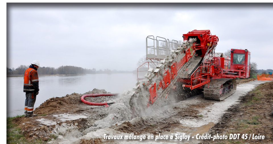
Travaux mélange en place à Sigloy

■ Suppression de la végétation encore présente dans les digues.